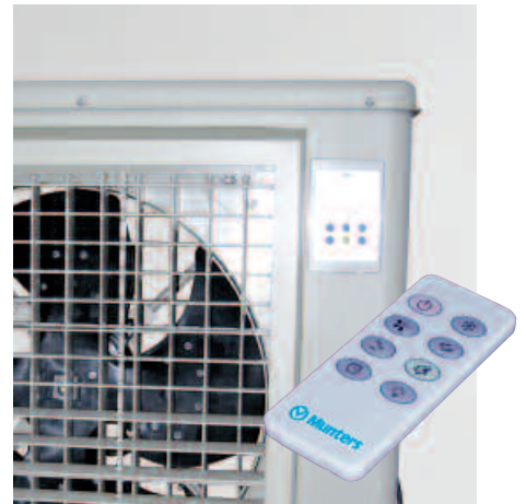
FCA 5F incluye una pantalla y un control remoto para simplificar el manejo.

hay un gran ventilador axial que absorbe el aire del exterior a través del panel. Cuando el aire atraviesa el panel saturado con agua, el aire se enfría. A continuación, el ventilador introduce el aire frío en las instalaciones.